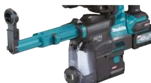
DX14: Sistema de extracción de polvo para HR002G (opcional). Cambio rápido.