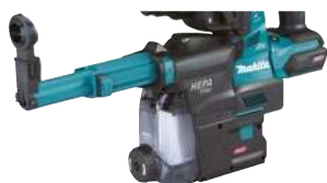
DX12: Sistema de extracción de polvo para HR001G (opcional).