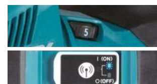
Velocidad variable. Sistema AWS Bluetooth.