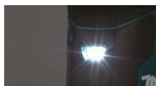
Luz LED de trabajo incorporada.